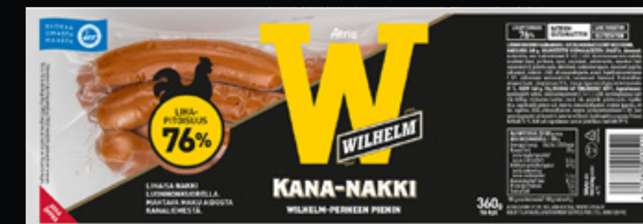
Atria Wilhelm Kuorellinen Kananakki 360g

Atria Wilhelm Luonnonkuorinakki Kaikilla Mausteilla 360g 617330 Me 4 kpl 617331 Me 40 kpl