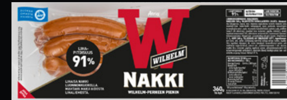
Atria Wilhelm Luonnonkuorinakki 360g

Nakista on moneksi. Lihaista vaihtoehto parempaan arkeen, ruoanvalmistukseen, vapaisiin viikonloppuihin ja rentoihin juhliin. Tuotteiden korkea lihapitoisuus sekä lihaliemi takaavat laadukkuutta arkeen, juhlaan ja vapaa-ajan hetkiin.